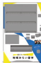
自動販売機イメージ

「地域みらい留学応援自動販売機」を設置いただくと、売上金額の一部が弊財団への寄付と なります。2023年3月末時点で、全国に35台設置(高校・民間企業・公共施設)いただいています。 手続きの詳細については、弊財団へ直接ご相談ください。