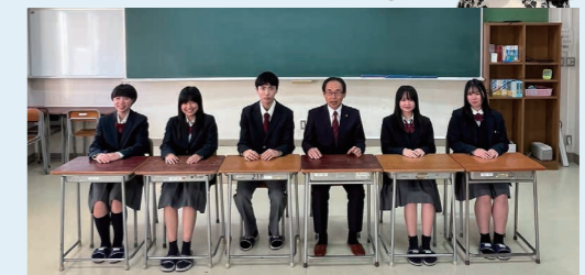
川俣町長と『魅力伝え隊』メンバーで懇談 - 地域の魅力について語り合いました！

2024年発足した「川高魅力伝え隊」は正式な部活動となり、生徒たち自身の言葉で地域の魅力を発信しています。「校長が説明するより、